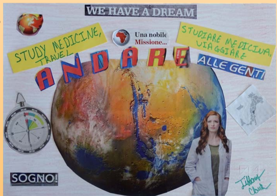
Le immagini sono state realizzate dalla studentessa del laboratorio Eda.